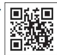
「コロナワクチンナビ」 二次元コード